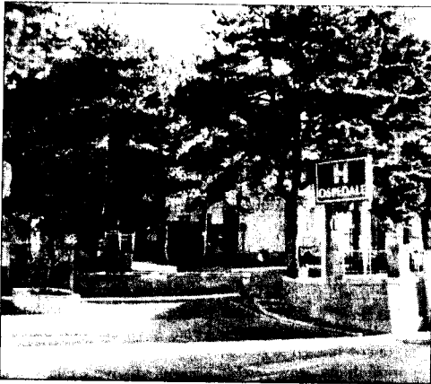
Il San Francesco Caracciolo

A battere i pugni sul tavolo, visti i lauti stipendi, anche chi afferma di assicurare lavoro e prestazioni più di tal altri colleghi. Il bubbone salta fuori con un provvedimento dirigenziale dell'Asrem altomolisano in attuazione di uno identico proveniente dalla sede centrale e di una deliberazione nelle quali si autorizza da parte della direzione generale lo svolgimento dell'attività aggiuntiva da parte della equipe di Anestesia e Rianimazione dei P.O. di Isernia-Venafro-Agnone, ma anche di Ostericia e Ginecologia, Radiologia e medicina veterinaria. Mentre