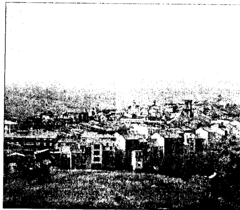
Veduta di Agnone

per le casse di una sanità ridotta oramai all'"ossigeno". La perplessità, in merito, nelle ultime ore, in ambito del Caracciolo, è diventata qualcosa di materiale fra gli stessi operatori. Ma soprattutto fra medici e medici. Il 9 settembre scorso il provvedimento di liquidazione e pagamento dei turni di attività aggiuntiva effettuati nel mese di agosto 2011 al di fuori dell'orario di servizio. Ed in totale si parla di decine di migliaia di euro non contabili sulle dita di una mano. Soldi entra pari quasi al triplo o più del doppio di quelli di un semplice mensile di un operario. E ciò al di là dello stipendio già roseo di taluni camici bianchi. Ma intanto, da quanto si sa, i numeri del nosocomio agnonese parlano di una bella differenza di interventi nell'arco di un anno.