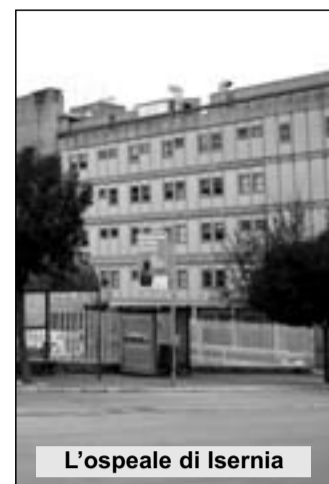
L'ospedale di Isernia

chiedono ancora i cittadini - come potevano essere gestite emergenze del genere nel momento di guasto degli ascensori?". In passato i pazienti sono stati portati persino a spalla da un piano all'altro nella speranza che fossero disagi temporanei. I guasti, però, continuano, anche a causa della vetustà dei materiali e delle apparecchiature. Da qui