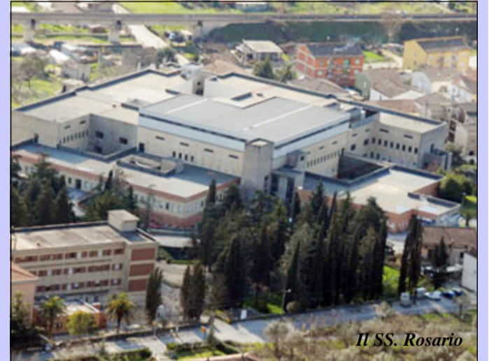
Il SS. Rosario

litica" e nulla più? Ossia a vendere chiacchiere? Beh se tanto fosse - ma ci rifiutiamo di crederlo! - è chiaro che l'iniziativa sarebbe da stigmatizzare! Partendo invece dal senso di responsabilità delle persone, soprattutto quando si ricoprono determinati ruoli politici, tanti venafрани non hanno affatto gridato alla scandalo per l'iniziativa dell'amministratore regionale e per il suo incontro coi lavoratori della struttura, se è vero com'è vero che si sono gettate le basi per una proficua collaborazione futura tra Regione Molise e SS Rosario. In effetti si è esaminata nei dettagli la realtà del nosocomio cittadino e si è detto a chiare parole che i pros-