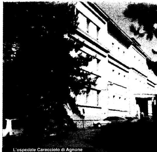
L'ospedale Caracciolo di Agnone

resto va bene. Con la crisi che c'è stata in tutta Italia, tutto sommato, l'ospedale sta funzionando bene. Non bisogna creare falsi allarmismi, altrimenti la gente penserà che non può più essere curata nella struttura. Il