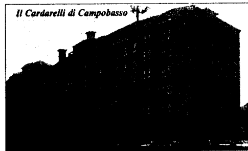
Il Cardarelli di Campobasso

Campobasso a farsi cura intasando così un centro che non ce la fa più. Per questo motivo, ho chiesto anche confronto con il direttore sanitario e l'assessore alla Sanità".