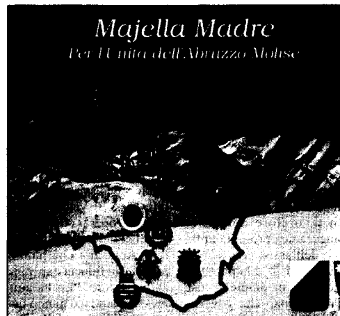
Majella Madre Per l'Unità dell'Abruzzo Molise

Tuttavia, secondo il sostenitore dell'associazione transregionale che ha come scopo il ricongiungimento e la fattiva collaborazione tra Molise ed Abruzzo, non bisogna gettare la spugna: "Avrei voluto sollecitare i miei compaesani a serrare le fila per difenderci da questi nemici e preparare quella che, credo, sarà l'ultima spiaggia della nostra difesa, prima della più triste, immeritata fine del nostro povero, vecchio, glorioso, caro Paese. Avrei voluto far presente ai miei compaesani che una trincea dove organizzare l'estrema difesa, all'ultimo sangue, dell'Alto Molise è Majella Madre che pochi co-