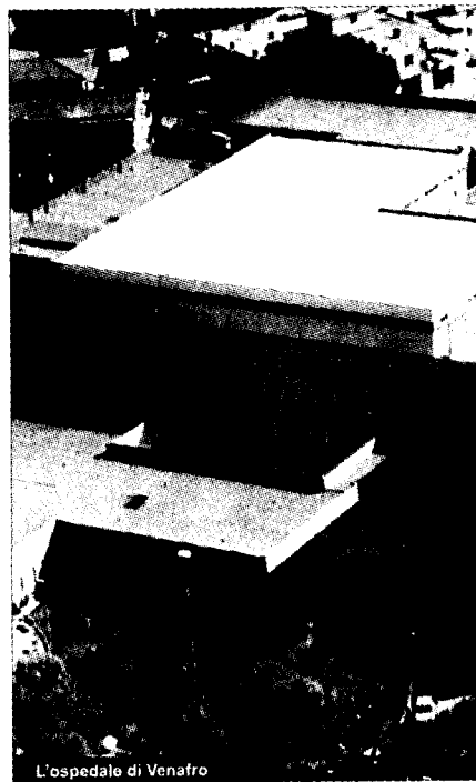
L'ospedale di Venafro

sostituito con una protesi umana prelevata dalla Banca delle Ossa di Bologna. Contemporaneamente è stata eseguita la rigenerazione dei tessuti con innesto di tessuto eterologo equino. Una novità importante che indica come i medici ortopedici dell'ospedale venafro affrontano questi casi. A questo punto i cittadini si chiedono il perché non viene potenziato il reparto con nuovo personale medico, paramedico ed ausiliario invece di farlo vivere alla