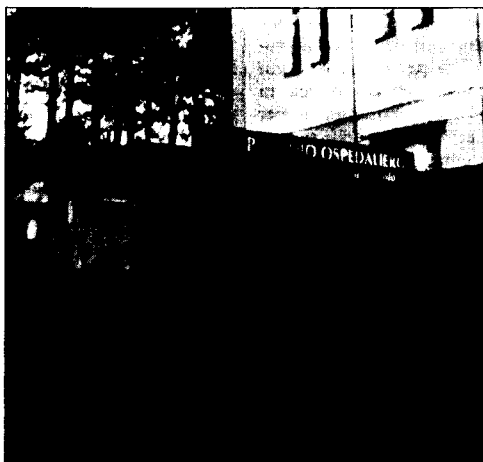
L'ospedale San Francesco Caracciolo

D'Onofrio lancia poi un messaggio ai concittadini agnonesi: "Avrei voluto ringraziare i miei compaesani per aver partecipato al fu-