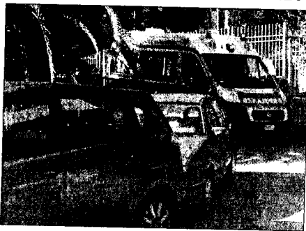
Le vetture in sosta selvaggia bloccano le ambulanze

Nell'indifferenza generale le auto bloccano le ambulanze