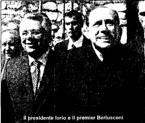
Il presidente Iorio e il premier Berlusconi

E' stato quotidiano il Sole 24 Ore, ieri mattina, a dare la notizia che nelle ultime ore da Palazzo Chigi è partita una lettera di diffida del Presidente del Consiglio Berlusconi con una sorta di ultimatum nei confronti della Regione Molise, che preluderebbe il commissariamento. Nella lettera si chiede anche un'accelerazione sui tempi per rendere subito operative le misure che azzerebbero il disavanzo. Pronta la reazione del Presidente Iorio che, tra l'altro, è titolare delle delega della sanità. "Occorre stringere i tempi per l'appro-