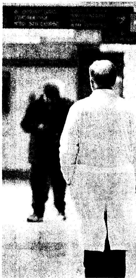
Sanità Sono giunte le sollecitazioni del governo

lusconi. L'assessorato alla sanità sta lavorando con impegno per assistere opportunamente la Giunta nelle azioni di sua competenza. Mi auguro che il Consiglio regionale dal canto suo approvi quanto prima il Piano sanitario e la riduzione delle Zone». I tempi quindi sono molto stretti. Le cose da fare sono molte a iniziare da alcuni accorpamenti di reparti ospedalieri che sono stati definiti da tempo ma su cui la Giunta ancora non si pronuncia. La cancellazione delle 4 Zone sono un atto amministrativo e soprattutto legislativo da attuare con immediatezza. Si eliminerebbero, così, costi abbastanza elevati in relazione al personale e in particolare al mantenimento di locali e di dirigenti. Una nodo da sciogliere rimane anche la riformulazione del contratto con la Cattolica a cui è stato assegnato un tetto di rimborso di circa 33 milioni di euro mentre ne viene avanzato un altro di almeno il doppio. Un problema che se passasse sarebbe come autorizzare il funzionamento di altro ospedale. Le osservazio-