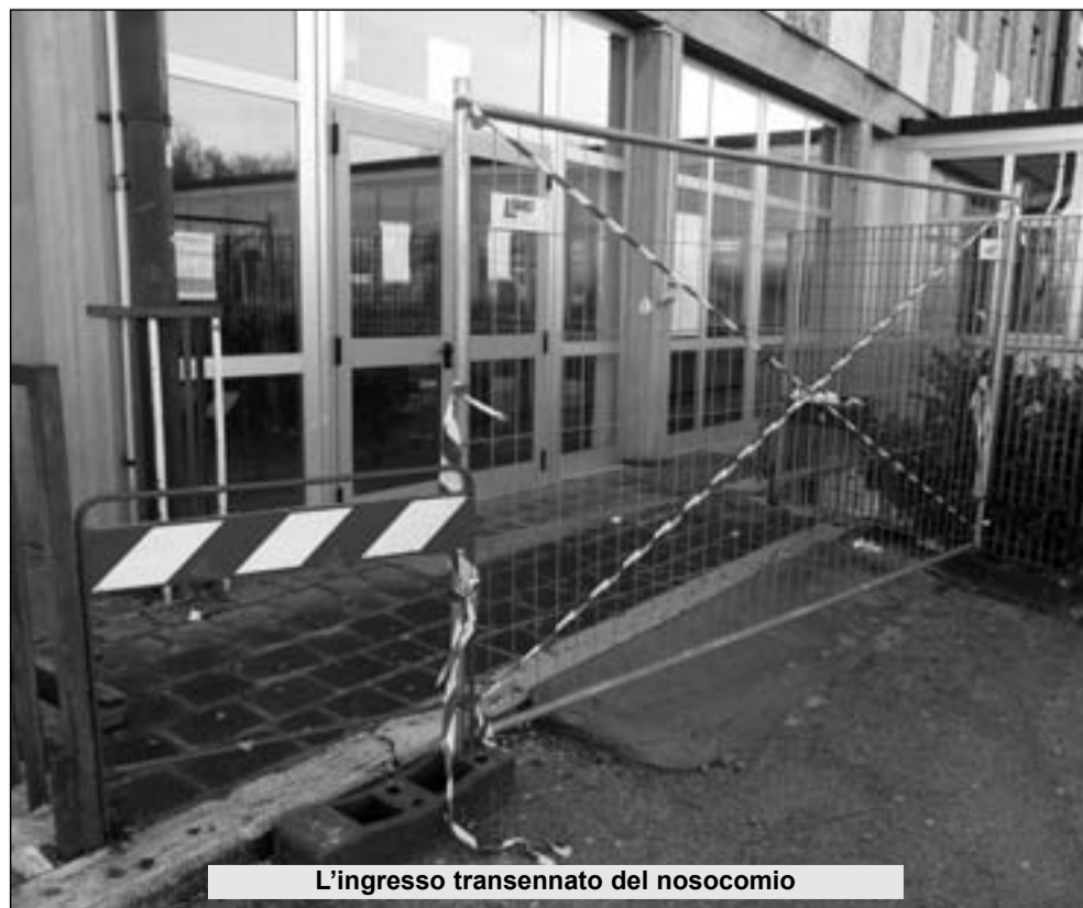
L'ingresso transennato del nosocomio