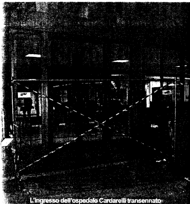
L'ingresso dell'ospedale Cardarelli transennato

CAMPOBASSO. L'ospedale Cardarelli perde pezzi. Alcuni calcinacci si sono staccati da una parete e hanno costretto i responsabili della struttura sanitaria di Campobasso a chiudere provvisoriamente uno degli ingressi principali, quello che si trova proprio di fronte al cancello di accesso all'ospedale. L'area è stata transennata in attesa che la parte dell'edificio dove si è verificato il cedimento venga messa in sicurezza.