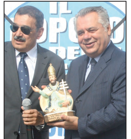
Borrelli omaggia il governatore