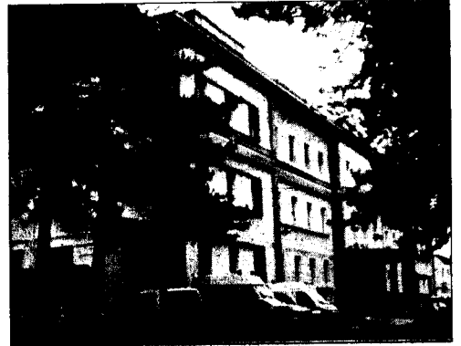
L'ospedale San Francesco Carracciolo

presente; che un reparto di Ginecologia non abbia medici per poter dare assistenza e lavorare in sicurezza; che per le urgenze ginecologiche il medico reperibile è presente solo per circa quindici giorni al mese che significa che pure per stare male bisogna farlo il giorno giusto!; che l'unico ortopedico è reperibile quando c'è ma se è in ferie o malato saltano ambulatori e consulenze di pronto soccorso. La realtà – conclude la Sciuillo- è che l'utente non ha mai colpe di disguidi e disagi e perciò tutti si attivano affinché ciò non succeda, questa è la filosofia di una struttura che se non si interviene a difenderla chiuderà”. Ma in questo bailamme che avvolge il Caracciolo c'è anche chi da merito ai medici di una ginecologia da ectoplasma. Ci riferiamo all'episodio della settimana scorsa quando “il 118 è