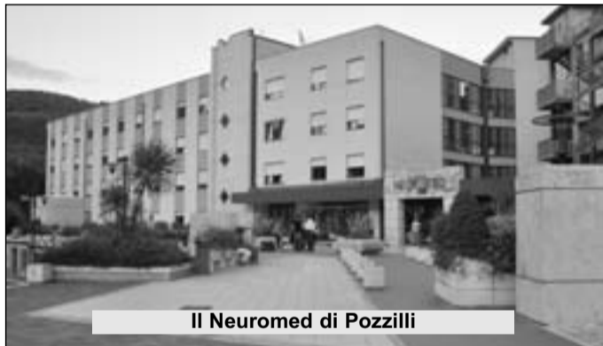
Il Neuromed di Pozzilli