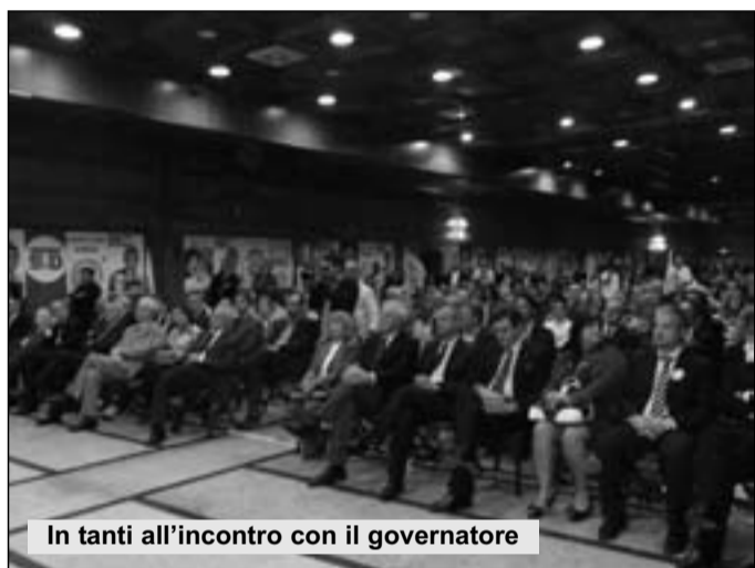
In tanti all'incontro con il governatore

Infine Iorio chiarisce le intenzioni future: "Hanno detto che, se vincerò, governerò solo per un anno e mezzo per tentare poi la carta della Camera o del Senato. Rispondo che già in passato ho rifiutato incarichi in Parlamento. Resterò in carica per 5 anni insieme a quelli che con me vorranno amministrare".