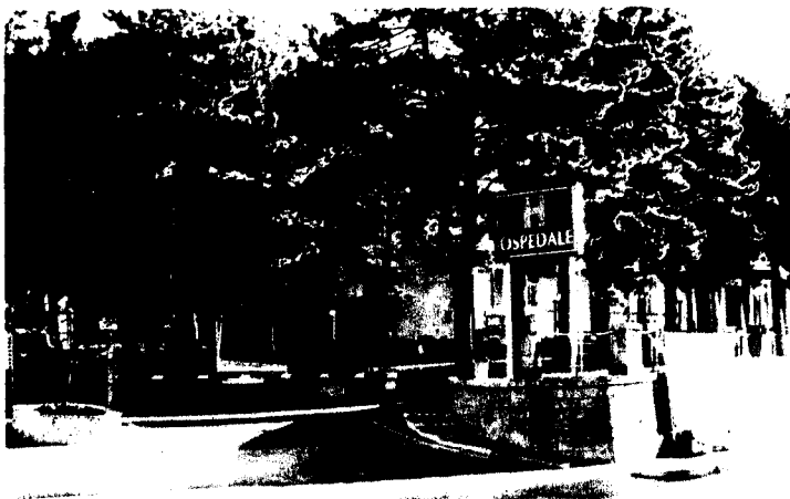
Nosocomio Unità di crisi al lavoro per la salvaguardia del presidio sanitario che accoglie pazienti dell'Alto Molise e di molti centri della provincia di Chieti