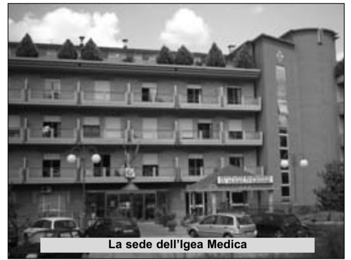
La sede dell'Igea Medica

Si addensano, quindi, le nubi sull'azienda con i pazien-