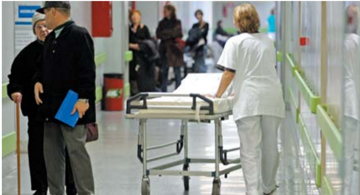
Negli ospedali Continuano le proteste per i disagi