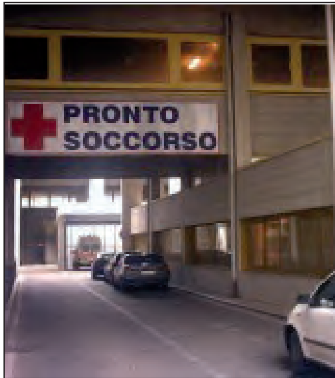
Il Movimento Larinascita in piazza per l'Ospedale Vietri

«Partendo dal piano di rientro licenziato dal governo nazionale fino all'ultimo provvedimento ancora ufficioso del Commissario ad acta Michele Iorio che prevede un criminoso accanimento nei confronti del Vietri e di tutto il territorio basso molisano a cui garantisce assistenza sanitaria -dicono dal movimento - Questa è la determinazione della scandalosa gestione sanitaria molisana che