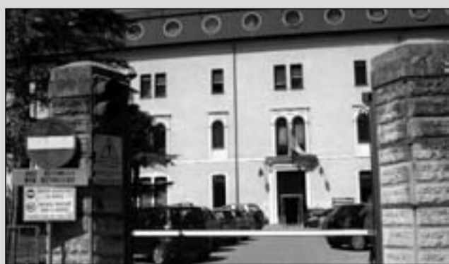
La sede dell'Asrem

C.da Colle delle Api - 86100 Campobasso - Tel. 0874 618827 - 483400 - 628249 - Fax 0874 484626 - E-mail: campobasso@primopianomolise.it