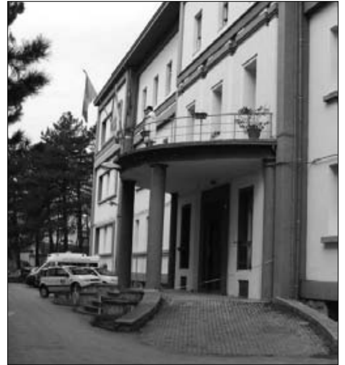
L'ingresso del Caracciolo di Agnone