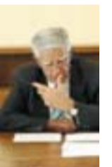
Passarelli L'assessore alla sanità chiamato ad un confronto

centinaia di operatori del settore sanitario, sono a rischio tutti i dipendenti del settore della vigilanza, della mensa e delle pulizie che operano all'interno delle strutture ospedaliere». Per evitare gravi ricadute sui livelli occupazionali, pertanto, la Uiltucs regionale Molise sollecita la creazione di un tavolo tecnico a cui dovranno partecipare le parti sociali l'assessore regionale alla sanità e il presidente della Regione, per procedere alla valutazione delle possibili soluzioni che vedano in prima fila tra l'altro, la tutela dei diritti dei lavoratori e del benessere dei cittadini.