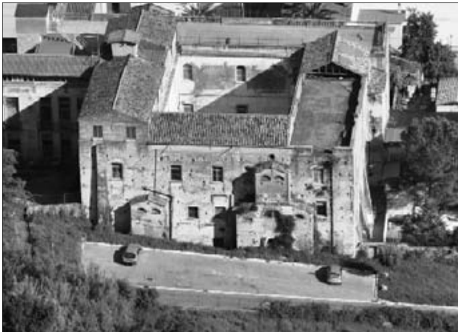
Il Carsic di Venafro