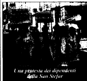
Una protesta dei dipendenti della San Stef ar

Il 2011, quindi, potrebbe riservare qualche colpo di scena. Finalmente positivo.