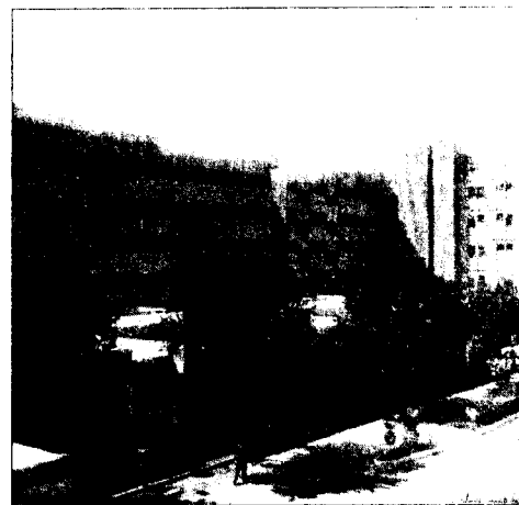
L'ospedale Veneziale di Isernia

fine del processo, convinta a dimostrare l'estraneità al fatto del proprio assistito.