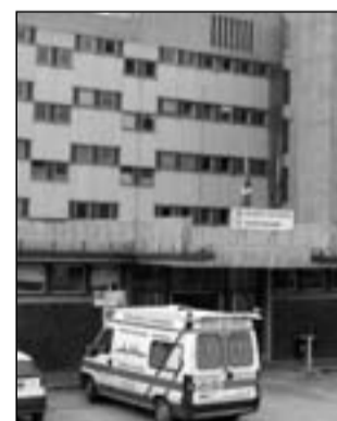
L'ospedale Veneziale assumerne altro nel periodo di ferie.

Questo è ciò che hanno deciso i medici del reparto di diabetologia dell'ospedale Veneziale di Isernia, accogliendo l'appello dei malati che erano pronti anche ad autotassarsi per pagare chi avrebbe dovuto sostituirli a luglio e agosto. La prospettiva di chiudere era diventata reale poiché il reparto ha poco personale e l'Asrem non era nelle condizioni di