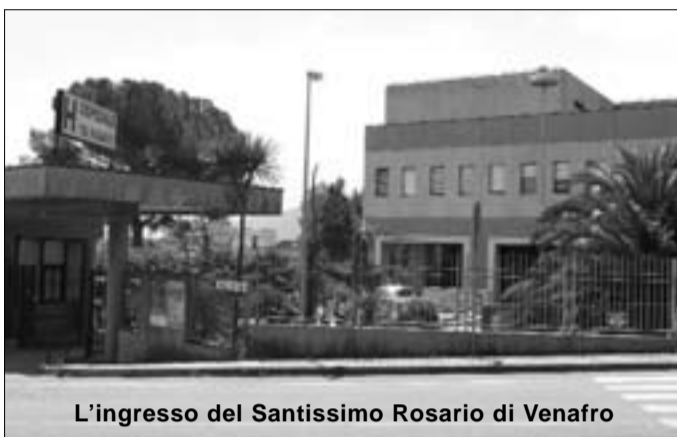
L'ingresso del Santissimo Rosario di Venafro