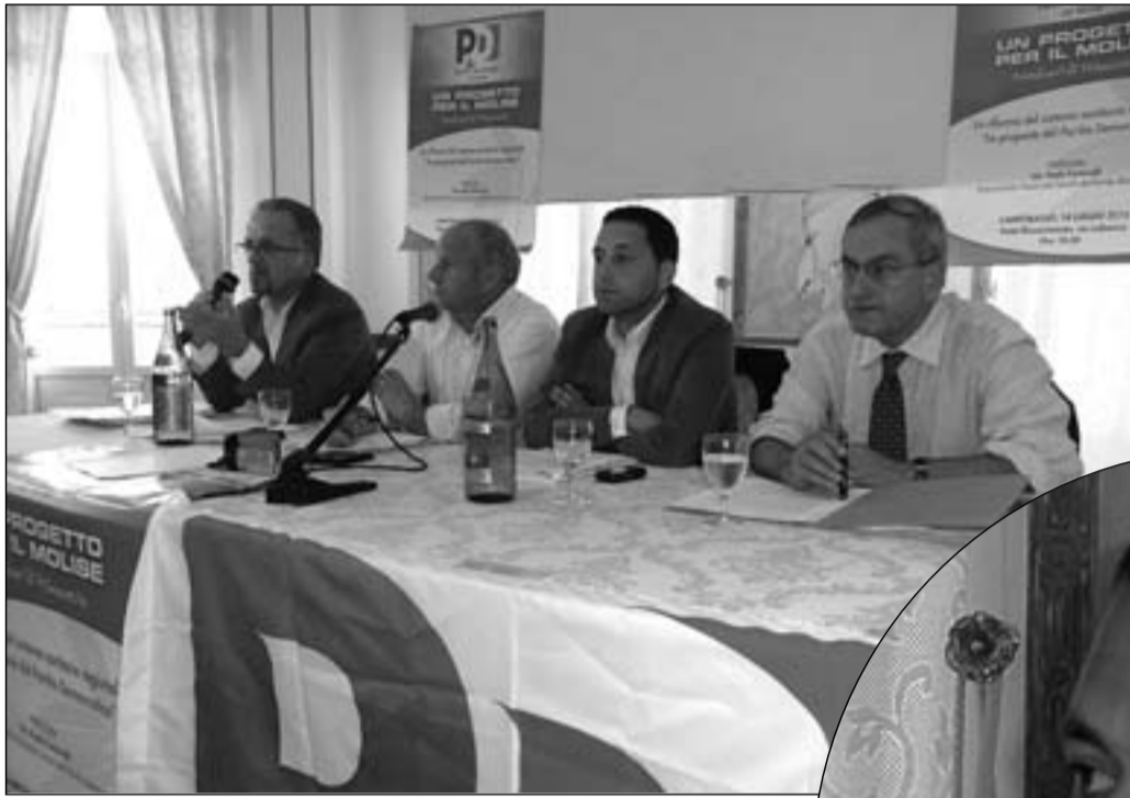
Nelle foto, alcuni momenti dell'incontro organizzato dal Pd