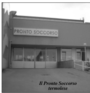
Il Pronto Soccorso termolese

I tempi di attesa potrebbero essere molto lunghi. Il codice verde viene indicato per i pazienti che presentano interventi differibili. L'assistenza viene assicurata dopo i casi più urgenti. Il codice giallo è destinato ai pazienti che presentano l'alterazione di una delle funzioni vitali (coscienza; respirazione; circolo). L'assistenza viene assicurata dal personale nel minor tempo possibile. Il codice rosso viene assegnato ai pazienti in condizioni molto critiche con pericolo imminente per la vita. Si spera che i medici, che hanno scelto come professione quello di salvare la vita, di curare ed assistere, possano essere rispettati così come loro lo fanno con ogni paziente che, grave o illeso, si presenti in ospedale.