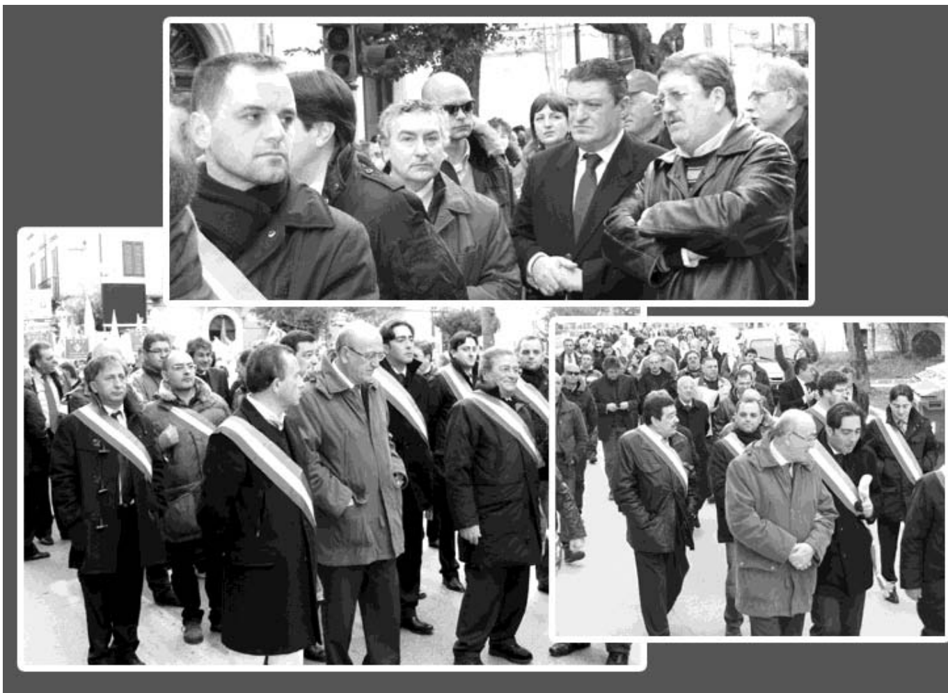
21 marzo 2010, diciotto sindaci promettevano: se il Caracciolo sarà toccato ci dimetteremo. Ad oggi solo balle!

La struttura diverrà un mix tra un mero poliambulatorio e una Residenza per anziani