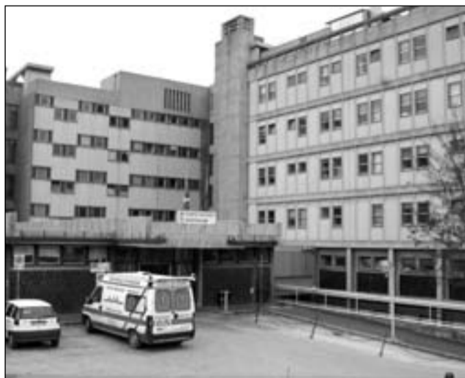
L'ospedale Veneziale di Isernia

"Finora hanno fatto molti sacrifici per arginare l'emergenza. L'unica soluzione sarebbe assumere altro personale"