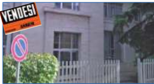
A sinistra l'immobile di via Garibaldi e a destra quello di via Duca d'Aosta