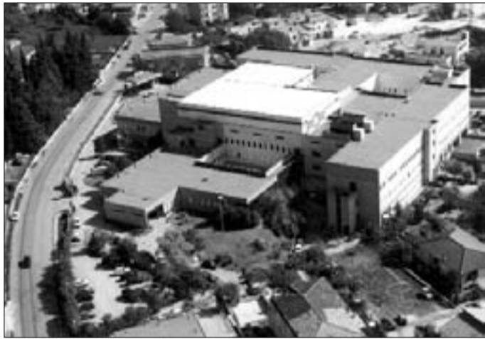
Il "Santissimo Rosario" di Venafro