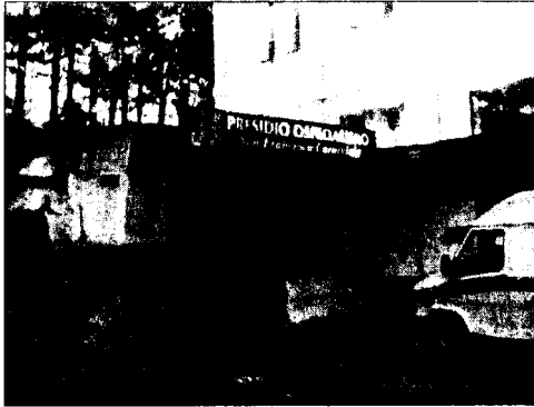
L'ospedale di Agnone