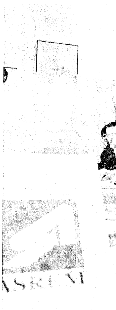
Delibera Già la prima ha scatenato un putiferio in regione

Il manager dell'Asrom attende le disposizioni del governo regionale sapendo che le iniziative in atto non completano il percorso di razionalizzazione come previsto dal Piano di rientro del settore