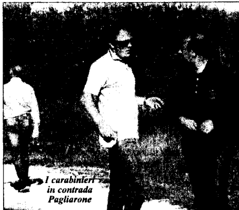
I carabinieri in contrada Pagliarone