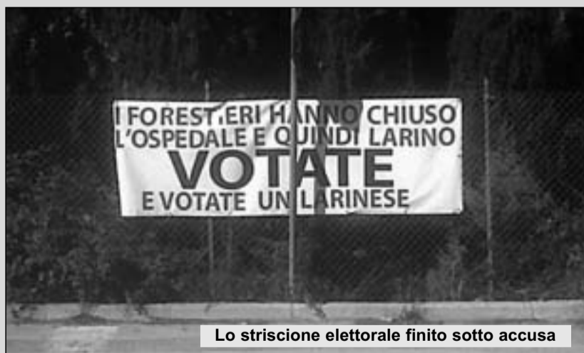
Lo striscione elettorale finito sotto accusa

strenua lotta per la sopravvivenza del nostro ospedale e per l'ottenimento di un'assistenza sanitaria pubblica efficiente. L'azione del Comitato è sempre stata distante da qualsivoglia posizione politica o personaggio politico e ci si guarderebbe bene dal fornire appoggio anche a sedicenti larinesi che, pur potendolo fare da amministratori comunali o consiglieri regionali, non hanno mai affiancato e sostenuto la battaglia a difesa di un bene che appartiene ad un intero territorio, i cui abitanti sono stati privati, per disposizione di Michele Iorio, dei livelli essenziali di assistenza". Nello stesso comunicato poi quelli del Comitato in riferimento all'apertura del Bambino Gesù si dicono disgustati "per la politica del taglio di nastri praticata da