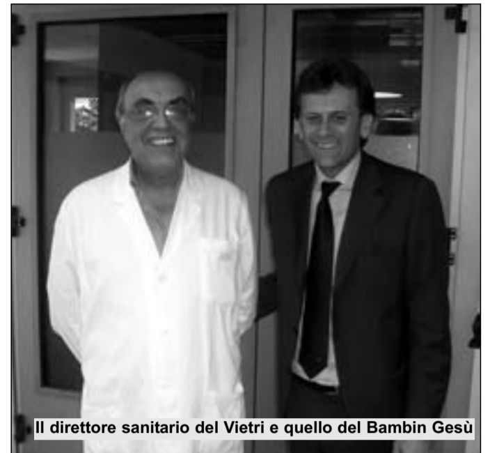
Il direttore sanitario del Vietri e quello del Bambino Gesù

cessibili e fruibili. E nel caso di Larino fruibili e facilmente accessibili da parte dei molisani e perché no della gente del vicino Abruzzo o della vicina Puglia". Questa mattina, dunque, al via l'attività dell'ambulatorio pediatrico e la formazione del personale locale. A partire dalla prossima settimana si andranno ad aggiungere le attività ambulatoriali specialistiche,