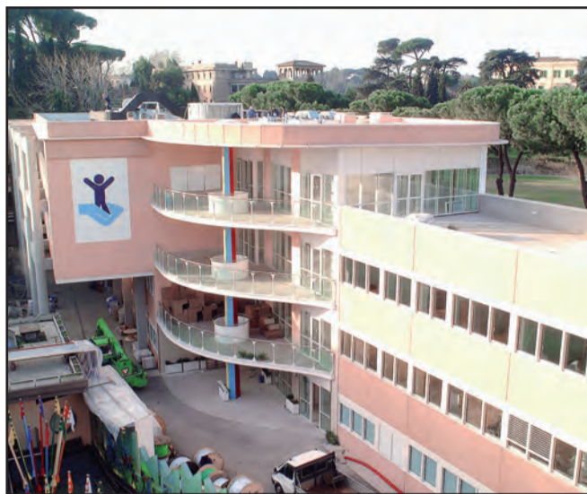
La sede romana dell'Ospedale Bambin Gesù

Da oggi la formazione, mentre dalla settimana prossima, poi, dalla prossima settimana apriranno le attività ambulatoriali specialistiche, quelle chirurgiche, i day hospital e i day surgery.