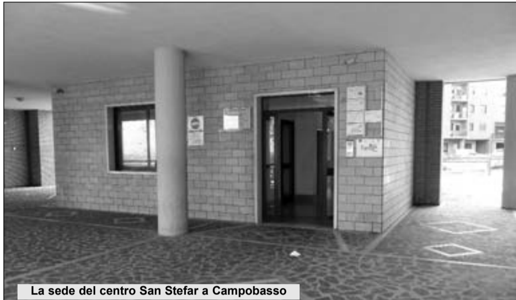
La sede del centro San Stefar a Campobasso