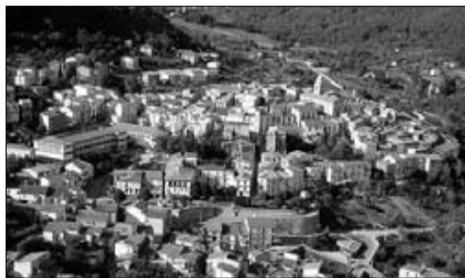
Una veduta di Civitanova del Sannio

CIVITANOVA DEL SAN- NIO. "Parkinson e parkinsonismi" è il tema del convegno con il quale a Civitanova del Sannio si celebra la quinta Giornata Scientifica Cardarelliana. L'evento rientra nelle manifestazioni per i 150 anni dell'Unità d'Italia, si svolgerà oggi a partire dalle ore 8,30 nell'Auditorium "Nuccio Fiord" ed è organizzato dal Comune, dagli ordini dei medici chirurghi e degli odontoiatri di Campobasso e Isernia, dall'Università del Molise, dall'Asrem e dall'Ipasvi. L'iniziativa è nata in occasione dell'anniversario dei 180 anni dalla nascita di Antonio Cardarelli a Civitanova del Sannio. L'il-