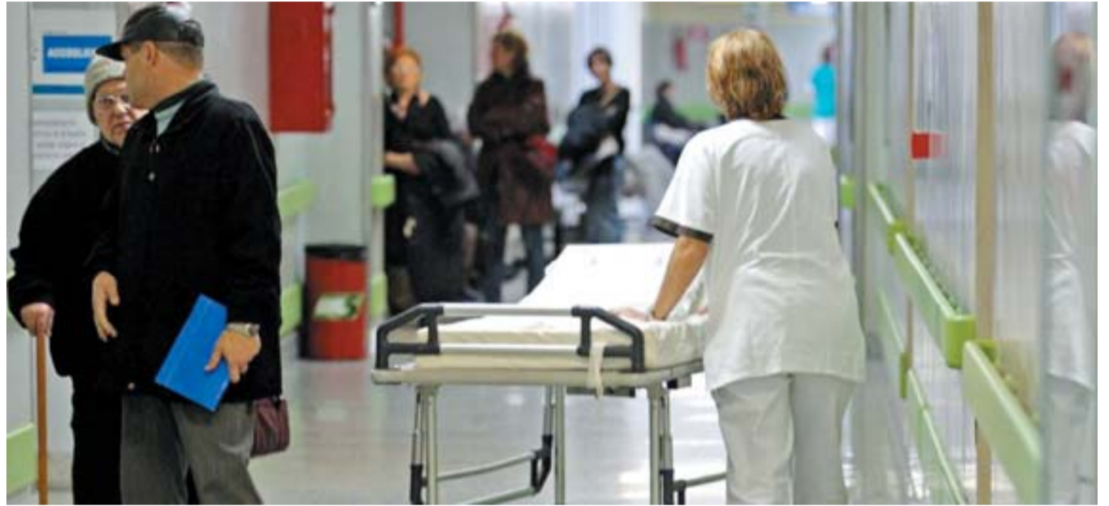
Ospedale I pazienti segnalano disagi nel reparto Dialisi

Pazienti È il numero di malati assistiti in questo momento nel reparto Dialisi