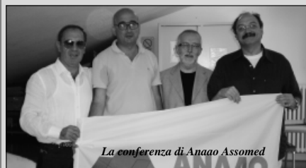
La conferenza di Anaao Assomed