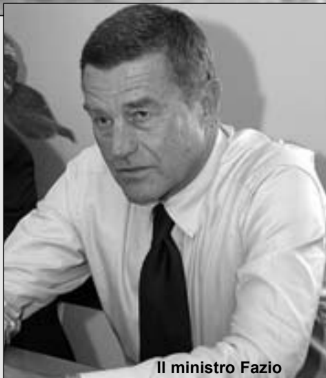
Il ministro Fazio

formazione e comunicazione "Estate sicura come vincere il caldo".