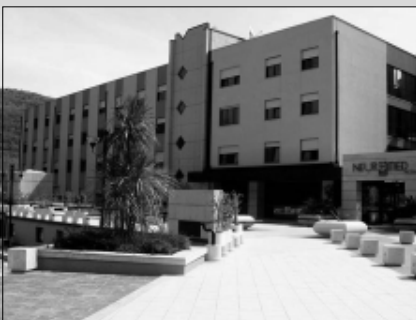
La clinica di Pozzilli

POZZILLI. Un uomo di 62 anni di Cosenza, riesce a tenere sotto controllo il suo tumore alla prostata, grazie ad una serie di esa-