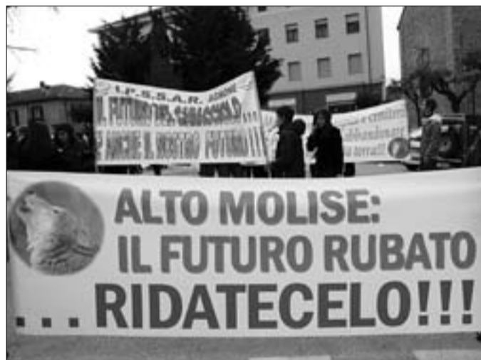
La manifestazione di domenica scorsa