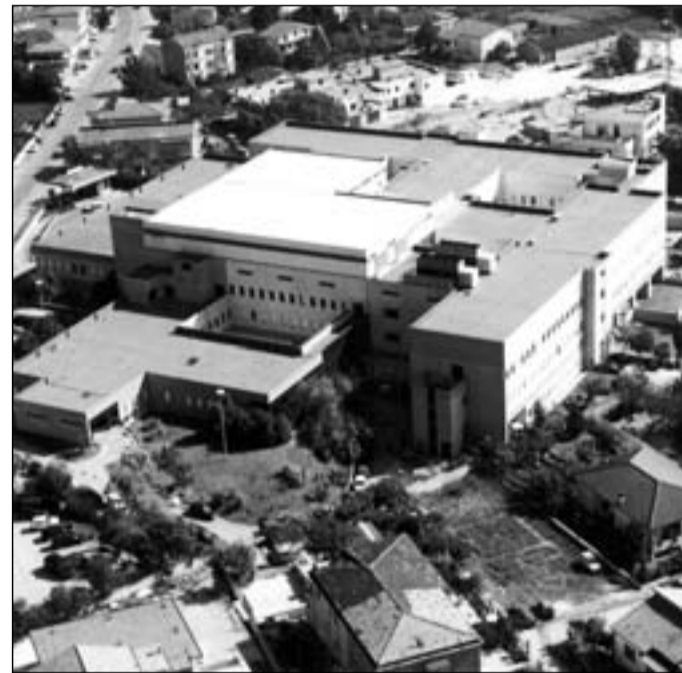
L'ospedale di Venafro

quadro complessivo della questione". Di tempo, davanti, la Regione ne ha ben poco per convincere i ministeri della Salute e dell'Economia sulla bontà delle azioni poste in essere per correggere il tiro della spesa che, fino ad oggi, ha prodotto tale situazione deficitaria. Entro il 15 aprile va presentato il Piano operativo che dovrebbe racchiudere tutti gli interventi possibili da mettere in agenda per dare una risposta al Governo, e al piano di rientro dal debito, e ai cittadini che hanno già manifestato contro i possibili tagli di posti letto che, di fatto, cancellerebbero