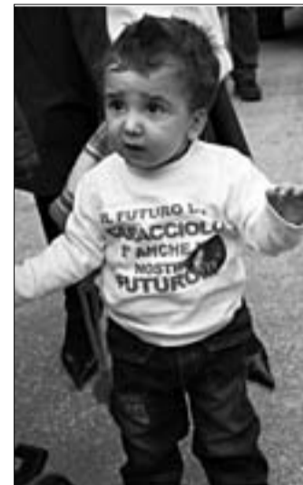
Anche i bambini in prima linea per la difesa del “Caracciolo”