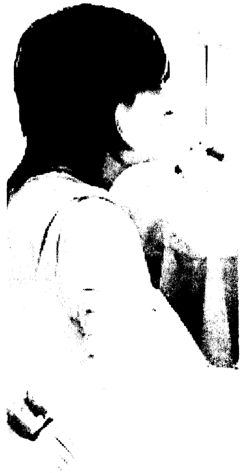
Vaccinazione Riguarderà il personale sanitario

Il primario di malattie infettive ha confermato i ricoveri di due pazienti. Uno è in via di completa guarigione il secondo invece si trova ricoverato in rianimazione