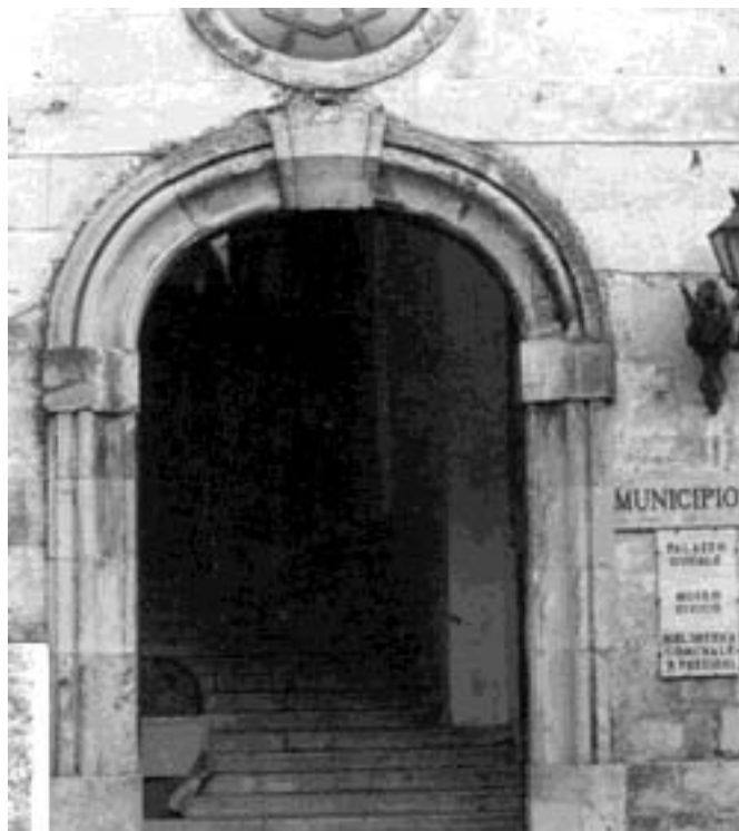
Il Municipio: sindaco e maggioranza sotto accusa