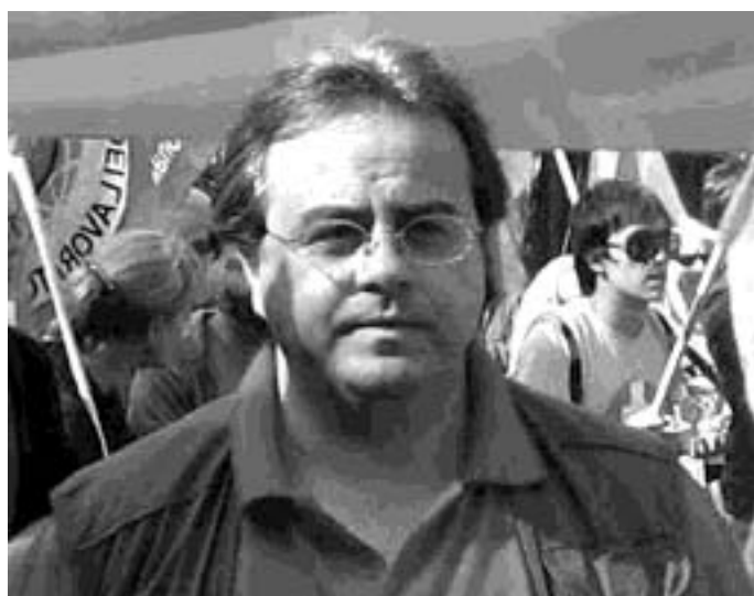
Il leader del Pcdl, Di Clemente

to. «In un solo anno i parlamentari incamerano redditi che da soli basterebbero a coprire circa il 60 per cento del deficit della sanità molisana (39,5 su 69 milioni). - continua Di Clemente - In un solo anno, incamerano quanto guadagnano 2.533 famiglie molisane con reddito di mille e duecento euro al mese. Senza contare il loro patrimonio personale. In merito il PCL Molise ribadisce la proposta di preparare un grande sciopero generale nel Molise ed una mobilitazione ad oltranza fino al ritiro della decisione del governo di scaricare brutalmente il deficit sanitario regionale sulle classi popolari molisane; per la cacciata del governo della regione Molise responsabile di politiche sanitarie finalizzate non al diritto universale e pubblico alla salute; perché, ferma restando la eliminazione degli sprechi fatti in favore delle varie cricche di potere regionale, si pretendano uno stanziamento nazionale sufficiente a coprire le esigenze di una sanità pubblica e riqualificata nel Molise ed una tassazione maggiore per le classi più ricche».