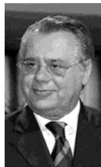
Il governatore Iorio

«Con quello che guadagnano si ripianerebbe il debito»