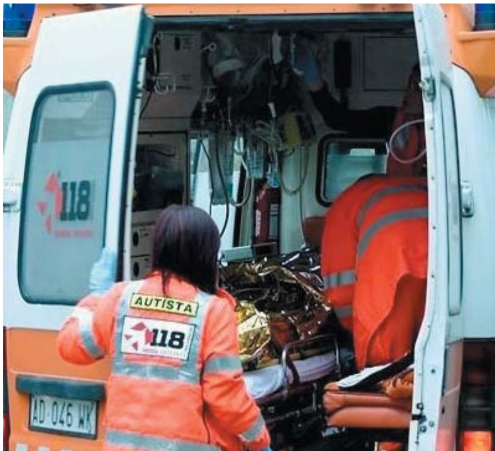
→ I volontari della Croce rossa in piazza ad Isernia